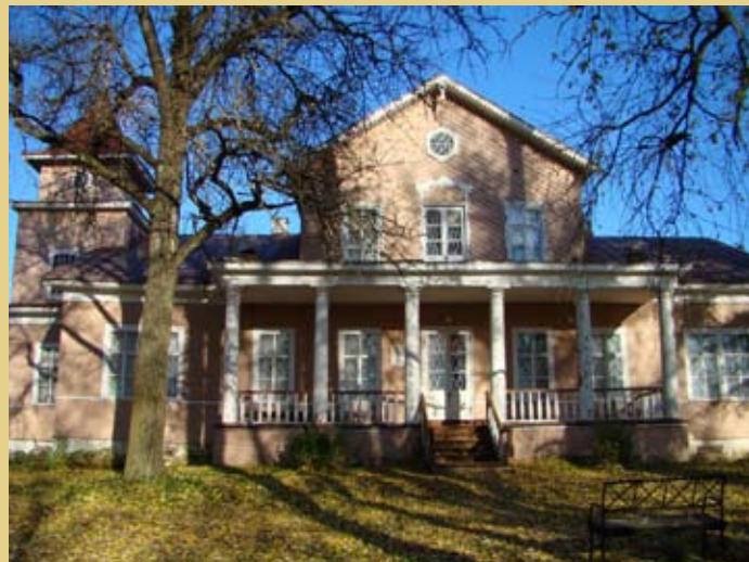
село Даниловское, усадьба Батюшкова К.Н.

Скончался Батюшков 19 июля 1855 г. в своём родовом гнезде в Вологде от тифа.